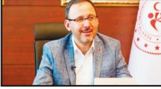
Gençlik ve Spor Bakanı Mehmet Muharrem Kasapoğlu. "Bu yıl rekor bir başvuru aldık ve

hamdolsun o rekor başvuruyu ilk faz yerleştirmemizde yüzde 80 üzerinde bir yerleştirme oranı yakaladık." dedi.